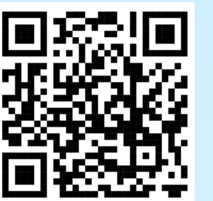
Muscore-Audio Part 5