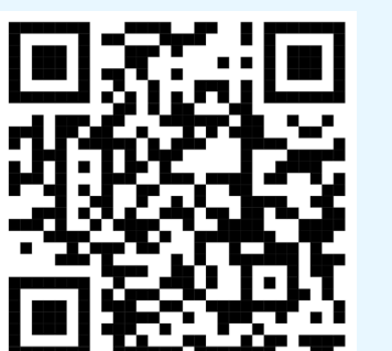
Ausschnitt 2. Variation